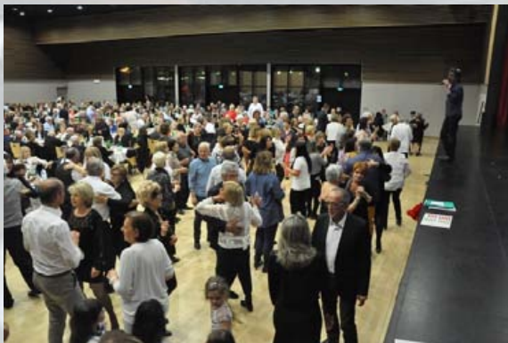
Gala du 30 mars 2019 à Chaponnay