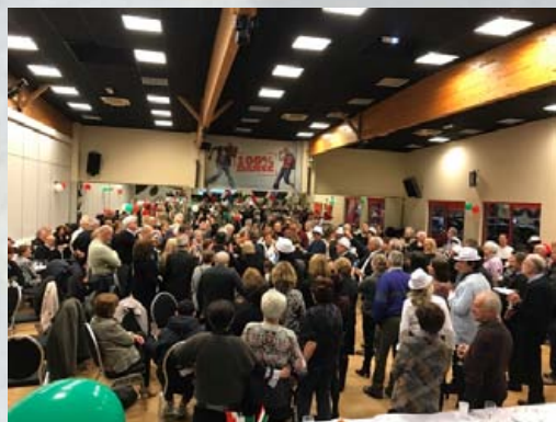
Soirée Partage du 2 février 2019 à Saint Pierre