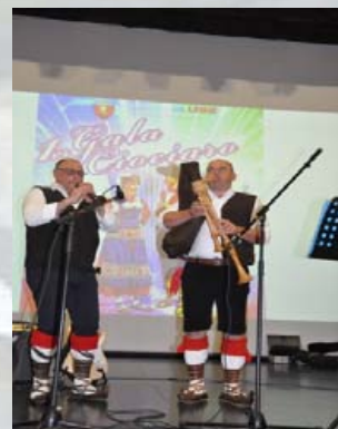
Zampognari de Picinisco.